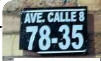
Fotografía No. 2 (Placa Domiciliaria).